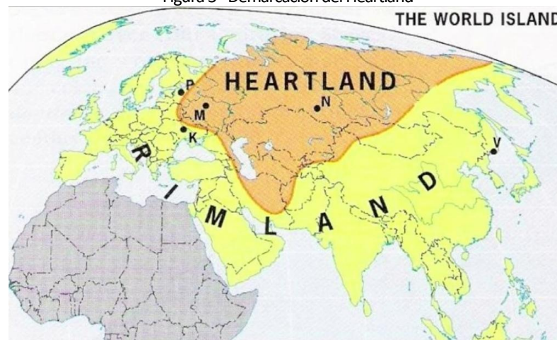
Figura 3 - Demarcación del Heartland

Esta gran área abarca desde el Círculo Polar Ártico hasta los desiertos y montañas del sur de Asia, tiene en su extensión territorial el Mar Báltico, el Mar Negro, el Mar Caspio y el Golfo Pérsico, aguas con gran énfasis para estrategias, especialmente comerciales. Las únicas rutas navales accesibles son las regiones del Mar Báltico y el Mar Negro. La parte norte, cubierta casi en su totalidad de nieve y hielo, está protegida por desiertos y montañas, lo que hace que el territorio sea prácticamente intocable por mar. Los diversos estrechos comprendidos en el Heartland pueden protegerse a través del poder terrestre (PETERSEN, 2011 apud KOTZ, 2018).