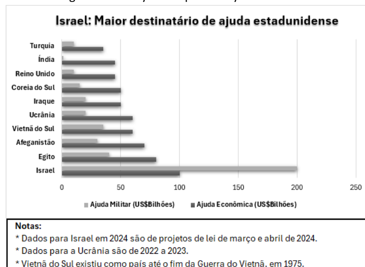
Figura 2 - El mayor receptor de ayuda de EE. UU.