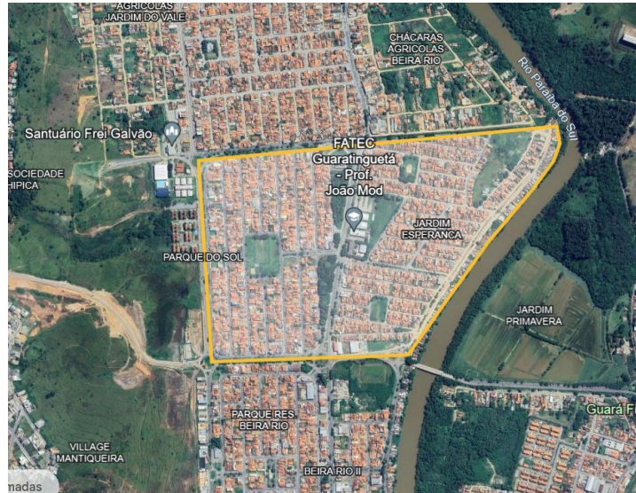
Figura 1: Delimitación de barrios vecinos FATEC – Guaratinguetá, SP.